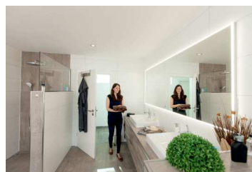
Gläser im Interieurbereich