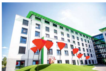
Gläser für Fenster + Fassade